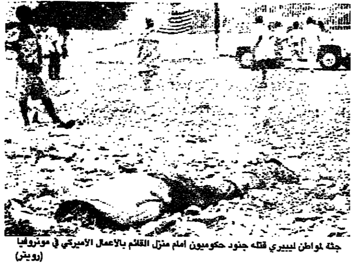
جثة مواطن ليبييرى قتله جنود حكوميين امام منزل القلم بالأعمال الايركي في مونروفيا

هرب مثلث من الناس من العاصمة الليبيرية المحاصرة، وانجسوا الى الحدود مع سيراليون، اثناء فترة هدوء في الحرب الأهلية، التي تشهدا البلاد منذ ستة اشهر.